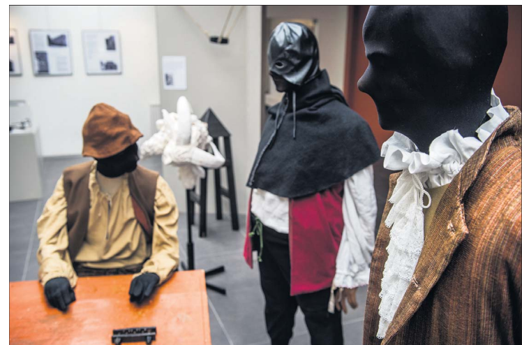
Van links naar rechts: Bokkenrijderskunst, het eerste boek over de Bokkenrijders, de spijkerwieg en de beul die zich klaar maakt voor een pijnlijk verhoor met de duim-schroeven.